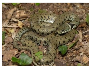
La Couleuvre à collier helvétique