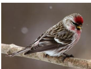
Le Faucon pèlerin