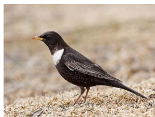
Le Merle à plastron